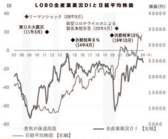
業況DI (※DI=「好転」の回答割合-「悪化」の回答割合)

●一方、深刻な人手不足による受注機会の損失や、長引く物価高による買い控えの継続など、国内需要の停滞が懸念される。コスト増が継続する中、持続的な賃上げに向けた労務費を含む価格転嫁の推進や生産性向上、人材確保などの対応すべき課題が多く、先行きは慎重な見方となっている。