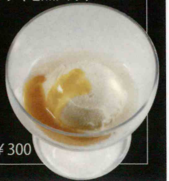
アイスクリーム 蒲郡みかんソース ¥300