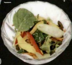
ガマカフェ サラダ ¥480