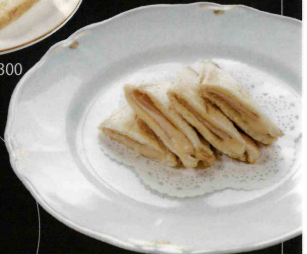
ハムチーズホットサンド ¥700