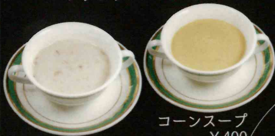
クラムチャウダー ¥500