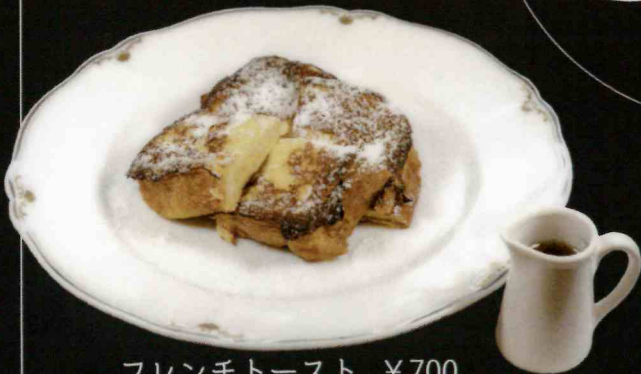
フレンチトースト ¥700