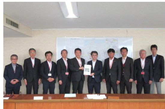
7/19 国道23号関係の要望