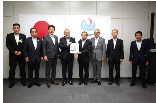
6/22 三河港振興会の要望