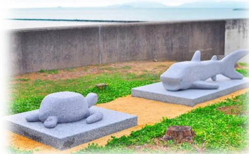
ベンチアートプロジェクト「海でつながる友好」