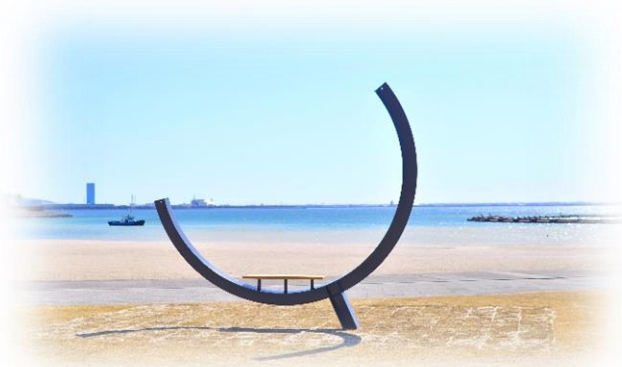
ベンチアートプロジェクト「見果てぬ夢」Unfinished Dream