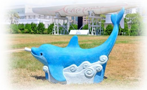
ベンチアートプロジェクト「コカリナを吹くドルフィン」