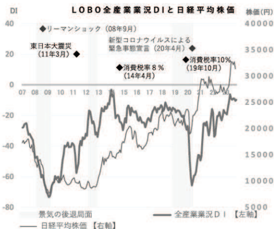
業況DI (※DI=「好転」の回答割合-「悪化」の回答割合)

●クリスマスや年末年始を契機とした個人消費の拡大や、インバウンドを始めとする観光需要の回復が期待される。一方、長引く物価高で日用品等の買い控えが続く中、エネルギー価格の高騰や円安の伸長によるコスト増が企業収益を圧迫している。また、深刻な人手不足や価格転嫁への対応に加え、欧州・中国等の海外経済の鈍化や緊迫が続く中東情勢など、先行きの不透明感が拭えず、慎重な見方が続く。