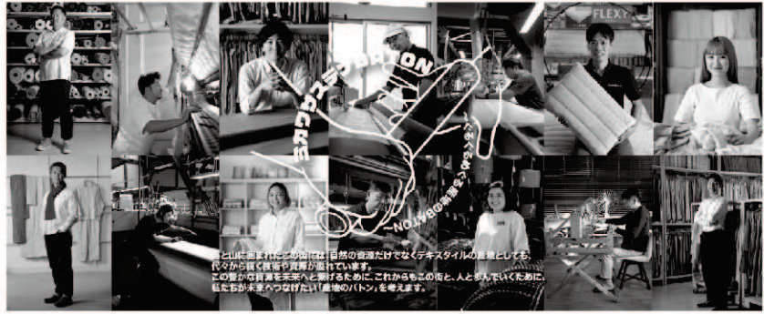
ミカワサステナBATON テックスピジョン 2023 ミカワ

蒲郡の繊維業界の祭典「テックスピジョン2023ミカワ」が、11月17日(金)・18日(土)の2日間、蒲郡商工会議所をメイン会場に開催されました。 このイベントは、蒲郡市、蒲郡商工会議所、三河繊維産元協同組合、三河織物工業協同組合、東三河染色協同組合、中部繊維ロープ工業協同組合が共催し、三河産地