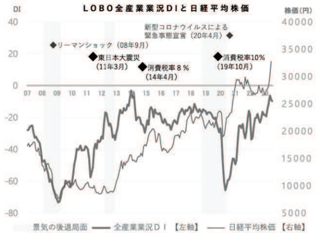
業況DI (※DI = 「好転」の回答割合 - 「悪化」の回答割合)

夏休み需要の本格化を控え、個人消費やインバウンド需要のさらなる拡大への期待感が伺える。一方、需要増に対する人手不足や、物価高による日用品等の買い控えへの懸念は継続している。また、政府の激変緩和策の段階的縮小でエネルギー価格は上昇傾向にあり、一層のコスト増が危惧されている。海外経済の鈍化による外需の停滞も懸念されており、中小企業の先行きは、慎重な見方が続いている。