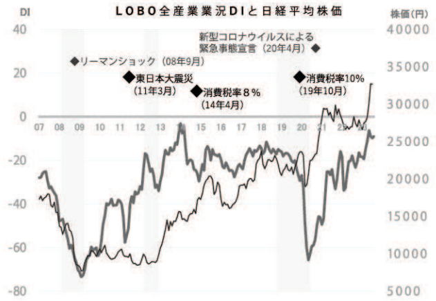
景気の後退局面 全産業業況DI (左軸) 日経平均株価 (右軸)

●秋の行楽シーズンでの個人消費の拡大や、インバウンド需要のさらなる回復への期待感がうかがえる。一方で、電気代やガソリン代等の高騰によるコスト負担増や、深刻な人手不足に一段と苦慮する声が業種を問わず聞かれている。コスト増に見合う十分な価格転嫁が行えておらず、生産性向上や人材確保等の諸課題解決に向けた原資の確保も難しい中、地政学リスクも高まっており、厳しい状況が続く。