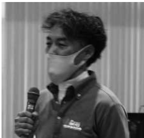
説明する蟹江委員長