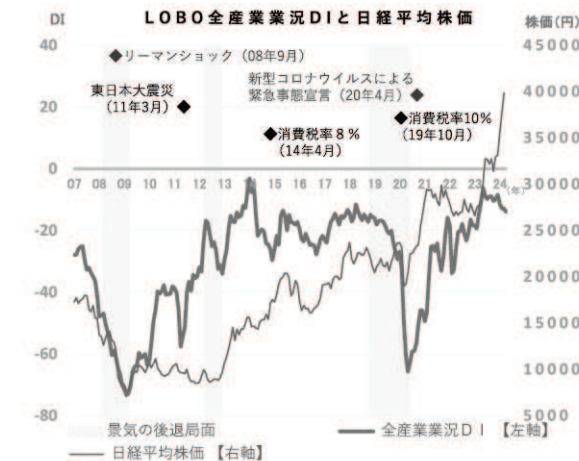
業況DI (※DI=「好転」の回答割合-「悪化」の回答割合)

●一方、大型連休等での国内外の観光需要のさらなる増加や、公共工事の本格稼働、企業の設備投資の拡大など、先行きは改善への期待感が高まっている。