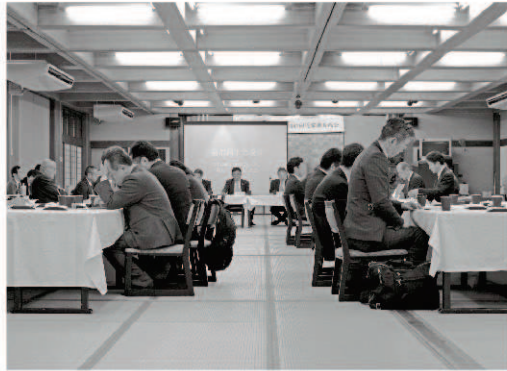
令和6年度事業計画