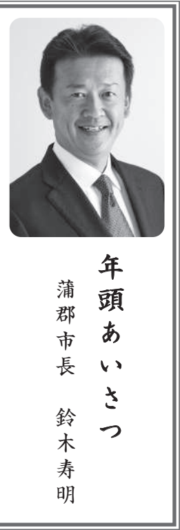
年頭あいさつ 蒲郡市長 鈴木寿明