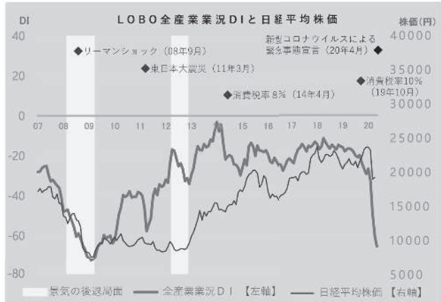
業況DI (※DI=「好転」の回答割合-「悪化」の回答割合)