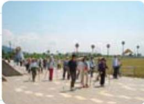
▶ラグーナ蒲郡を眺め ながら歩くウォーキング コースも整備